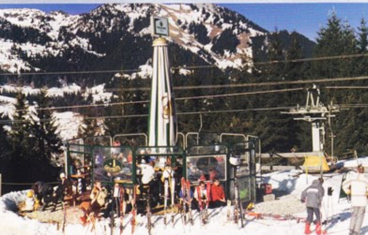
Mal Open-Air, mal unterm Schirm, aber immer frisches VELTINS!

Jung und Alt ist eines der attraktivsten und größten zusammenhängenden Skigebiete Oberbayerns.